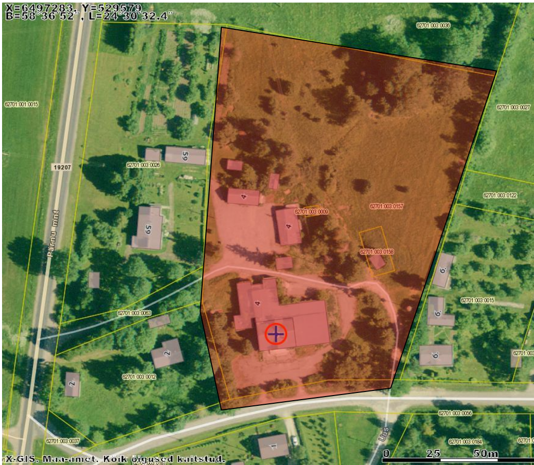
Joonis 1. Planeeritava ala skeem. Planeeritav ala märgitud punasega.